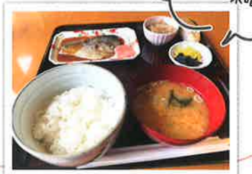
人気メニュー「サバの味噌煮定食」