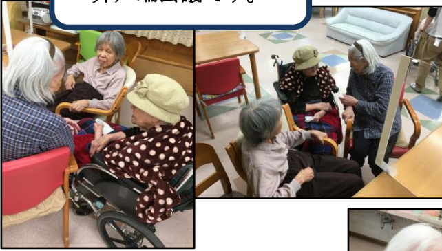
寝る前の楽しそうな 井戸端会議です。