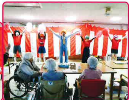
★サービス計画課・ヤングマン

「生きる」を支える 私たちの仕事は「生きる」を支える仕事です。この世に生を受けて以来100年近く命をつなぎ、そして今の時代を作り、支えてこられた利用者の皆様から感謝します。最後の最後まで私たちに介護という仕事を与えてくださり、そして糧を与えてくださり本当にありがとうございます。 当法人もひまわりの丘を開設してからこの春で丸19年となり、令和2年度は20年目の年となります。また新米の施設でもわかりませんが、「当たり前」のようにこの挨拶していたことが昨日のことのようで、また、今でも同じようなスタンスでい続けていることに気が付きます。 今般、新型コロナウイルスの感染拡大により、世界中が感染予防、パンデミック対策に躍起になっています。私たち介護に携わる者たちは、毎年インフルエンザやノロウイルス感染をはじめとした感染予防については多くの経験を積み重ね、利用者の方々に安心して過ごしていただけるような空間を提供してきました。しかしながら、今回の新型コロナウイルス感染については、未知の部分が多岐にわたります。手探りの部分もいくつかありますが、より正確な情報を得て、迅速に正しく行動することで、利用者皆様の安全と安心を、そして「生きる」を支えていくことが私たちの使命だと考えています。 これから先も様々な困難があるとは思いますが、人生の最後の時間をお過ごしいただく場所として、皆様の信頼を得て事業を継続することに真摯に取り組んでいきたいと思っております。