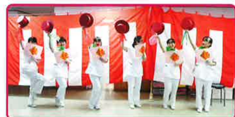
★看護課・華麗なるダンシング