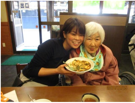
とらやで昼食です。