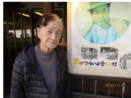
寅さんと記念撮影。