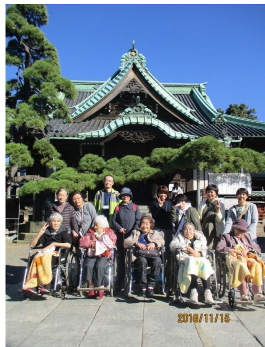
ほんとに楽しい二日間でした。また行きたいですね。