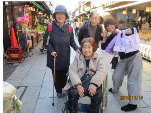
お土産もたくさん買いましたよ。